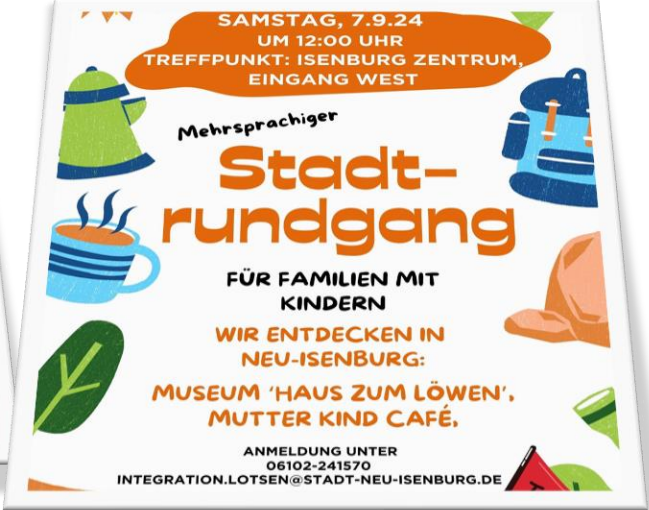
FAMILIEN MIT KINDERN